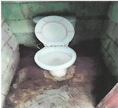
Foto1: Sustitución de tasa sanitaria y colocación de piso antideslizante y azulejo en el baño.